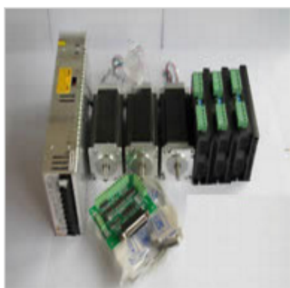
3 Axis NEMA 23 CNC KIT

Man kan købe digitale linealer til at sætte på. Det er ligesom en digital skydelære, men de er ligeså dyre som at bygge maskinen om med nedenstående CNC- sæt. Hvis det kom på, blev maskinen pludselig 1000 gange bedre! og kan meget mere nøjagtigt forarbejde de krumelure småting jeg vil have svært ved at klare på maskinen i hånden.